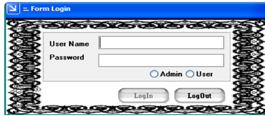
Gambar 1. Form Login