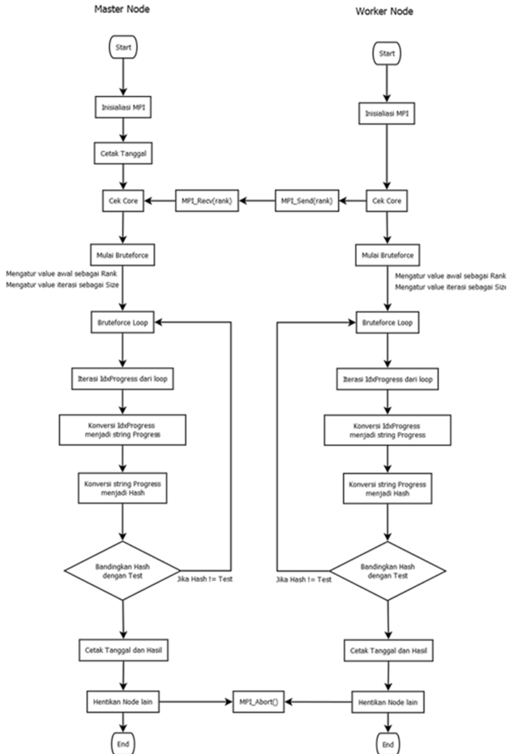
Gambar 2. Diagram alur program Brute-force MD5

hasil terbaik. Proses ini diulang sehingga didapatkan perangkat lunak yang sesuai dengan kebutuhan. Berikut adalah diagram alur perangkat lunak: