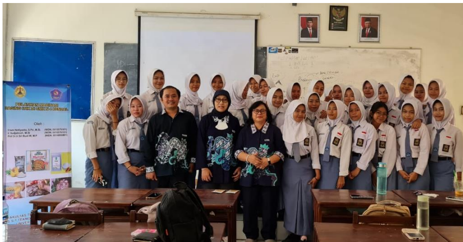
Gambar 3. Pelatihan Marinasi Daging Itik di SMK N4 Kendal

Berdasarkan Gambar 2. Hasil kuisioner pengetahuan siswa SMKN 4 Kendal terhadap pengertian marinasi semuanya sudah tahu, karena peserta merupakan siswa jurusan tata boga sehingga pengetahuan tentang pengertian marinasi cukup memahami, akan tetapi untuk cara pembuatan marinasi sebelum pelatihan 85% tidak tahu cara pembuatan marinasi dimana siswa belum pernah pelatihan atau cara membuat marinasi sehingga sosialisasi yang diadakan tim PKM USM merupakan hal yang baru. Para siswa selain belum tahu cara pembuatan marinasi sebanyak 60% siswa sebelum adanya pelatihan tidak tahu bahan marinasi itu apa saja yang digunakan, dan sebagian sudah mengetahui karena pernah membaca dikemasan marinasi dan media sosial. Siswa sebelum adanya pelatihan 75% tidak tahu manfaat dari marinasi selain dibuat untuk bumbu masakan itu apa saja kegunaannya. Setelah di adakan pelatihan marinasi daging itik siswa SMK N 4 Kendal 100% siswa cukup memahami dan tahu pengertian marinasi, cara pembuatan, bahan dan manfaat dari marinasi. Dalam pelaksanaan pengabdian pelatihan marinasi daging itik diharapkan para siswa-siswi SMKN 4 Kendal memahami tentang proses marinasi dan kegiatan dapat bermanfaat selain meningkatkan pengetahuan juga dapat meningkatkan kecakapan hidup siswa. Hasil Pelaksanaan Pengabdian Pelatihan Marinasi Daging Itik di SMKN 4 Kendal dapat di lihat pada Gambar 3.