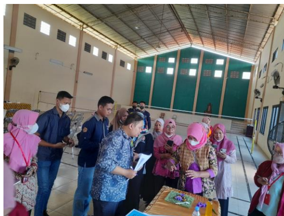
Gambar 4. Praktek fotografi produk yang menarik

Selanjutnya adalah dokumentasi kegiatan praktek teknik memfoto produk yang didampingi oleh bapak Adinova Trisetiyanto, M.Pd.