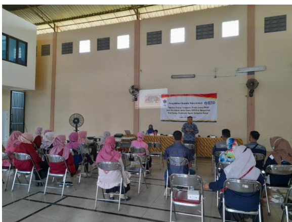
Gambar 3. Materi teknik display produk yang menarik

Berikut dokumentasi materi pelatihan Teknik memotret produk yang menarik oleh Bpk. R. Irlanto Sudomo, M.Pd.