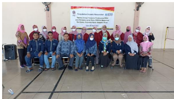
Gambar 5. Penutup kegiatan dengan foto bersama

Pada tahap evaluasi, tim pengabdian melakukan evaluasi mengenai respon peserta terhadap kegiatan sosialisasi yang telah dilakukan melalui penyebaran angket di sertai dengan penutupan dengan foto bersama antara tim dosen pengabdian dan para peserta.