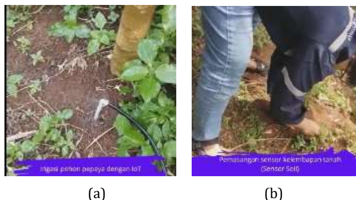
Gambar 5. (a) Otomasi irigasi (b) Pemasangan Sensor Soil

Kegiatan difusi Ipteks akan melibatkan implementasi teknologi IoT yang nyata pada kelompok tani melalui pemasangan sensor kelembaban tanah, suhu, dan pompa otomatis berbasis IoT di kebun mereka. Teknologi ini bertujuan untuk memberikan solusi praktis dalam perawatan tanaman, seperti otomatisasi penyiraman yang berbasis data kelembaban tanah dan pengendalian penggunaan air yang lebih efisien. Selain itu, teknologi IoT ini juga akan memberikan data yang real-time untuk petani, yang dapat membantu mereka memantau kondisi lahan dan tanaman secara terus-menerus, sehingga pengelolaan tanaman lebih terkontrol.