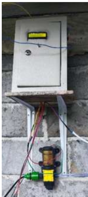
Gambar 2. Sistem penyiraman otomatis berbasis IoT

Untuk itu, pengabdian ini dirancang untuk mengatasi berbagai permasalahan tersebut melalui penerapan teknologi Internet of Things (IoT) (Pereira, Silva, & Gomes, 2023), yang dapat membantu dalam memantau kondisi tanaman secara lebih presisi dan efisien. Sistem yang akan diterapkan diharapkan dapat meningkatkan efisiensi penggunaan air, mengurangi kerusakan akibat hama, serta mempermudah petani dalam mengelola perawatan tanaman berbasis data yang lebih akurat.