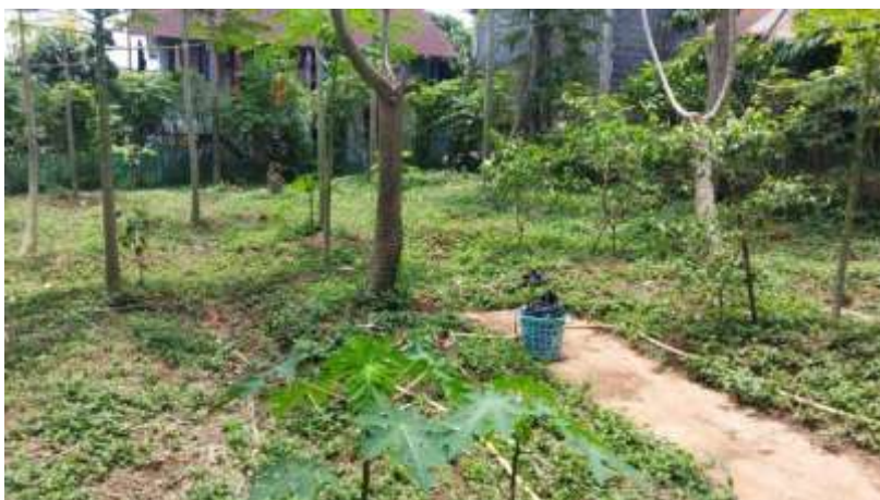
Gambar 1. Kebun pepaya yang sistem irigasi manual

Kelompok Tani Melati Makmur, yang terletak di Desa Mlatiharjo, Kecamatan Patean, Kabupaten Kendal, menghadapi beberapa masalah signifikan dalam mengelola usaha pertanian mereka, khususnya dalam budidaya tanaman buah. Permasalahan utama yang dihadapi oleh petani adalah ketidakmampuan dalam mengelola sumber daya alam secara efisien, terutama dalam hal penggunaan air dan pupuk. Penyiraman tanaman selama ini dilakukan secara manual tanpa mengandalkan data akurat mengenai kondisi kelembaban tanah (Sudjatinah, Wibowo, & Gunantar, 2024). Hal ini menyebabkan pemborosan air, di mana tanaman sering kali kekurangan atau kelebihan air, yang berdampak pada penurunan kualitas tanaman serta produktivitas hasil panen.