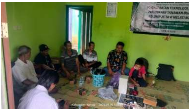
Gambar 4. Pelatihan IoT kepada kelompok petani

Metode pelatihan akan difokuskan pada pembekalan keterampilan praktis bagi para petani untuk mengoperasikan sistem IoT yang telah dipasang di lahan mereka. Pelatihan ini akan dilakukan secara langsung di lapangan, di mana petani akan diajarkan cara membaca data dari dashboard IoT (Sunaryo, 2023), mengoperasikan pompa air otomatis, serta memahami prosedur standar penyiraman berbasis data kelembaban tanah. Melalui pelatihan ini, petani akan memperoleh keterampilan dalam menggunakan teknologi pertanian modern, yang diharapkan dapat meningkatkan efisiensi dan produktivitas pertanian mereka.