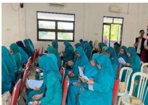
Gambar 5. Tahap evaluasi pre test dan post test

Pada Gambar 4 menunjukkan bahwa kader PKK sangat antusias dengan adanya demonstrasi dan praktek secara langsung buku AR yang dibuat oleh Tim Pengabdian, karena buku AR dilengkapi dengan suara hujan petir dan simulasi banjir dan ada jalan cerita dalam buku tersebut karakter dinamai dengan Wono dan Sari sesuai dengan Kelurahan Wonosari. Begitu juga terdapat ransel siap siaga dan jalur evakuasi diharapkan masyarakat Kelurahan Wonosari lebih tanggap dan siaga adanya bencana banjir. Sesi diskusi dan tanya jawab untuk menggali pemahaman serta mendapatkan umpan balik menjelaskan diskusi dan tanya jawab kader PKK menanyakan apakah masing-masing kader PKK RW mendapatkan buku tersebut karena sangat antusias sama sekali dan ingin dipraktikkan sampai di rumah untuk menjelaskan ke anak-anak TK dan SD. Tahap ketiga adalah evaluasi menggunakan instrumen pre-test dan post-test untuk menilai peningkatan pengetahuan peserta dapat ditunjukkan pada Gambar 5.