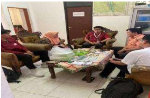
Gambar 2. FGD dengan Kepala Kelurahan Wonosari

Pada Gambar 1 menjelaskan Tahap pertama Pra Pelaksanaan koordinasi mendalam dengan mitra Kelurahan Wonosari dengan melakukan Focus Group Discussion (FGD) dengan Kepala Kelurahan Wonosari yang dilakukan pada tanggal 11 Juli 2025. Tujuan utama dari FGD adalah untuk memperoleh gambaran menyeluruh terkait capaian kegiatan pengabdian yang telah dilaksanakan, sekaligus mengidentifikasi permasalahan yang muncul di Masyarakat berkaitan mitigasi banjir melalui edukasi media interaktif AR dengan simulasi pada saat banjir.FGD dengan Kepala Kelurahan Wonosari dapat ditunjukkan pada Gambar 2.