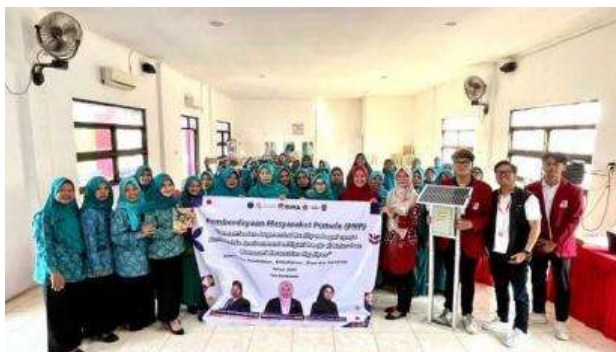
Gambar 6. Foto Bersama Kader PKK dan Tim Pengabdian

Pada Gambar 6 menunjukkan bahwa Foto tersebut menggambarkan momen kebersamaan antara paraKader PKK Kelurahan Wonosari dan Tim Pengabdian setelah pelaksanaan kegiatan edukasi mitigasi banjir berbasis Augmented Reality (AR). Kehadiran kader PKK menunjukkan komitmen mereka dalam mendukung program pemberdayaan masyarakat dan peningkatan kesiapsiagaan bencana di lingkungan sekitar. Sementara itu, Tim Pengabdian hadir untuk memberikan pendampingan, pelatihan, dan inovasi media edukasi AR sebagai upaya meningkatkan pemahaman warga mengenai langkah-langkah mitigasi banjir. Foto ini menjadi simbol kolaborasi antara masyarakat dan tim akademisi dalam membangun lingkungan yang lebih tangguh, peduli, dan siap menghadapi risiko bencana.