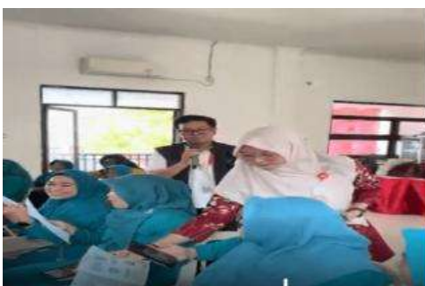
Gambar 3. Penyampain materi mitigasi banjir

Pada Gambar 2 menjelaskan FGD yang sudah dilaksanakan dengan tim pengabdian Universitas Ivvet yang terdiri dari dosen dan mahasiswa dengan Kepala Kelurahan Wonosari. Tahap ke dua Pelaksanaan Kegiatan terdiri dari penyampaian materi konseptual mengenai risiko, mitigasi, dan kesiapsiagaan bencana banjir. Materi ini bertujuan memberikan pemahaman kepada kader PKK, mengenai pentingnya pengelolaan risiko bencana secara terpadu. Materi risiko bencana banjir disampaikan dengan menekankan pada faktor penyebab, potensi kerugian, serta dampak sosial-ekonomi yang mungkin ditimbulkan. Pada bagian mitigasi, peserta diajak memahami langkah-langkah strategis untuk mengurangi risiko, baik melalui edukasi, penyuluhan, dan penguatan kelembagaan masyarakat. Materi mitigasi banjir ini disampaikan oleh Tim Pengabdian dapat ditunjukkan pada Gambar 3.