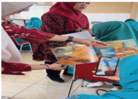
Gambar 4. Demonstrasi dan praktek langsung penggunaan AR

mengetahui mitigasi banjir dilanjutkan dengan demonstrasi dan praktik langsung penggunaan aplikasi Augmented Reality oleh seluruh peserta menggunakan ponsel pintar masing-masing yang ditunjukkan pada Gambar 4.