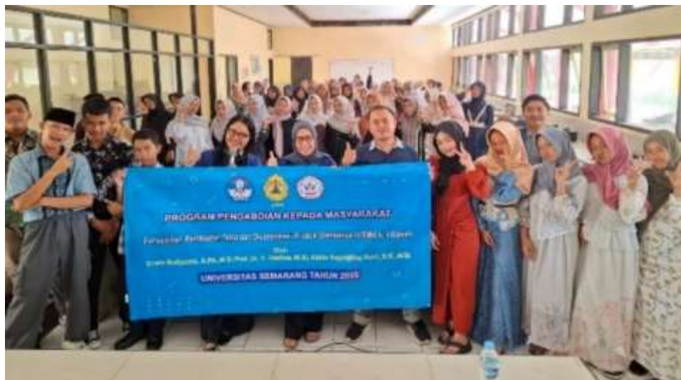
Gambar 2. Penyuluhan Pembuatan Nata dan Diversifikasi Produk Olahannya

Pembahasan terkait diversifikasi produk nata juga menjadi bagian penting dalam kegiatan ini. Pengenalan berbagai bentuk produk olahan seperti minuman nata, dessert, pudding, dan camilan berbasis nata terbukti mampu meningkatkan minat dan kreativitas siswa dalam mengembangkan produk inovatif. Hal ini menunjukkan bahwa diversifikasi produk berperan strategis dalam meningkatkan daya saing produk hasil pembelajaran sekaligus menumbuhkan jiwa kewirausahaan siswa. Temuan ini sejalan dengan hasil penelitian sebelumnya yang menyatakan bahwa pengembangan produk berbasis fermentasi lokal dapat menjadi sarana efektif dalam menanamkan kompetensi kewirausahaan di sekolah kejuruan (Mustofa et al., 2024).