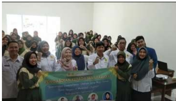
Gambar 2. Dokumentasi Kegiatan PkM di SMKN H. Moenadi Ungaran