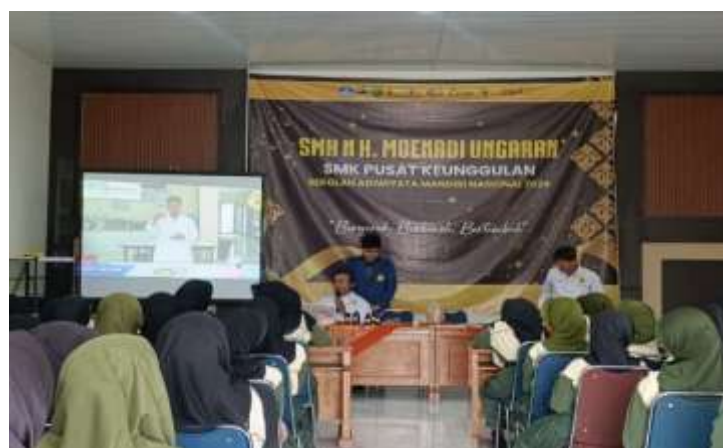
Gambar 3. Penyampaian materi oleh tim PkM