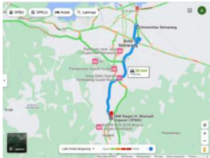
Gambar 1. Peta Lokasi Mitra SMKN H. Moenadi Ungaran