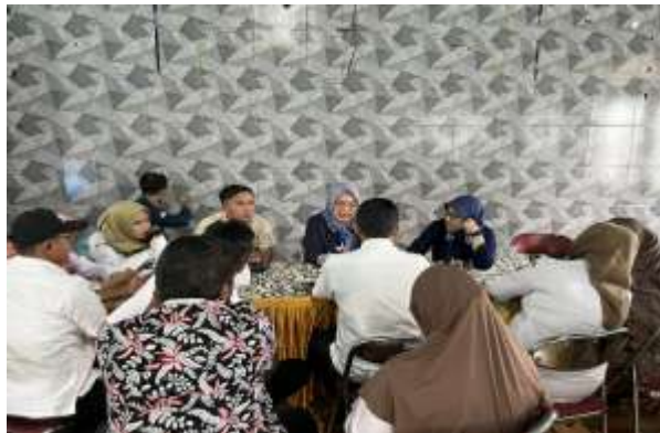
Gambar 1. Koordinasi Awal dengan peserta

Dokumentasi kegiatan pendampingan penguatan profitabilitas bisnis sebagaimana gambar-gambar berikut: