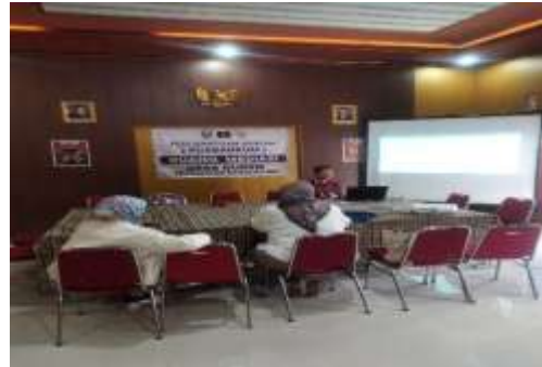
Gambar 4. Focus Group Discussion Produk Ketapang