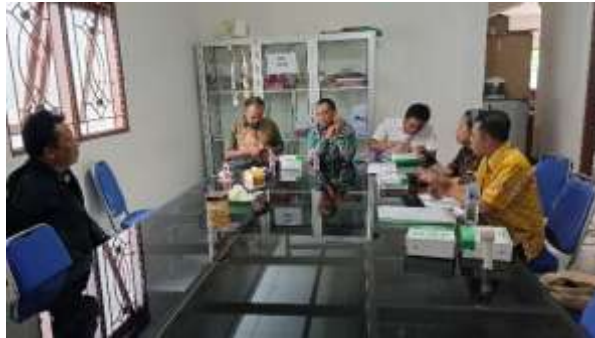
Gambar 3. Pendampingan pengumpulan data potensi desa