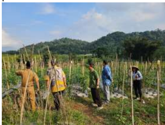
Gambar 5. Pengumpulan data dan orientasi di lapangan