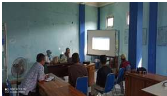
Gambar 7. Pendampingan guna mensepakati hasil akhir