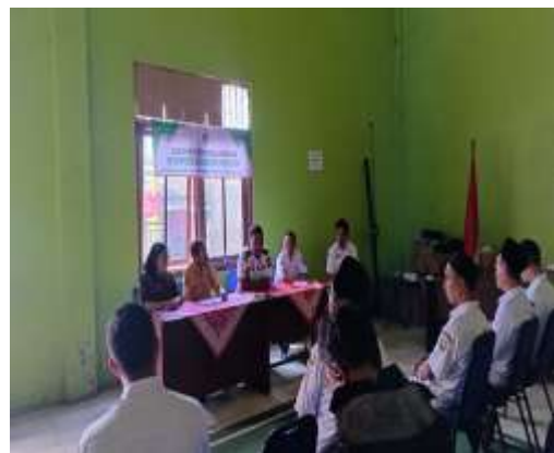
Gambar 6. Pendampingan Penyusunan Laporan