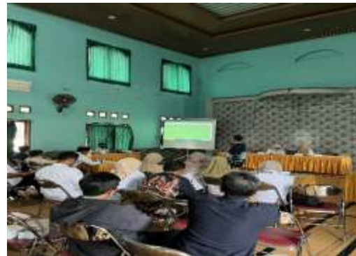
Gambar 2. Pembekalan dan Peningkatan kapasitas