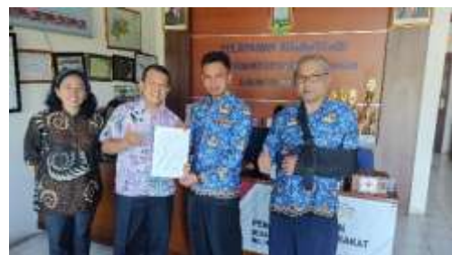
Gambar 8. Penandatanganan Berita Acara Serah terima Laporan