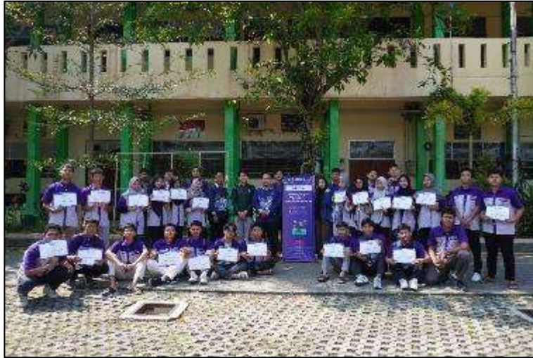
Gambar 4. Foto bersama dengan Siswa dan Tim PkM