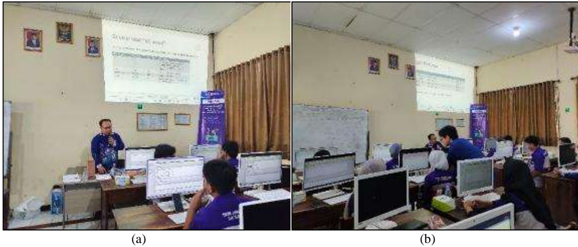
Gambar 2. (a) Penjelasan tentang tabel dengan PhpMyadmin , (b) Tim dibantu mahasiswa untuk membantu kalau ada siswa yang kesusahan

Untuk gambar 3 (a) dan (b). tim memberikan sebuah soal dan ada dari siswa yang maju kedepan dengan mengerjakan dan berhasil menyelesaikan soal mendapatkan dorprize.