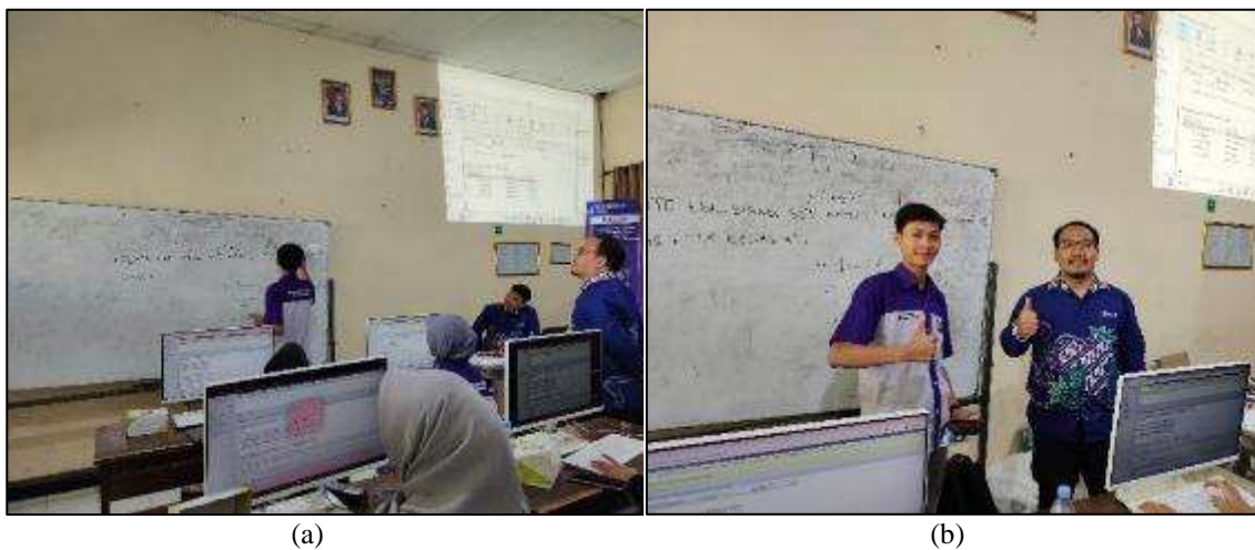
Gambar 3. (a) Siswa berhasil mengerjakan soal yang diberikan, (b) Pemberian Doorprize

Untuk gambar 3 (a) dan (b). tim memberikan sebuah soal dan ada dari siswa yang maju kedepan dengan mengerjakan dan berhasil menyelesaikan soal mendapatkan dorprize.