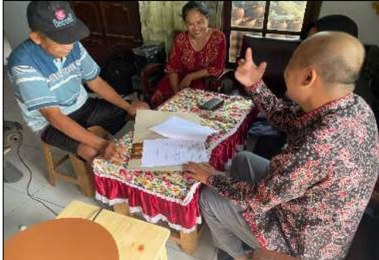
Gambar 4. Penyuluhan Postur Kerja Sesuai Aspek Ergonomi

bagian motor dan pengontrol putaran untuk memastikan keselamatan kerja serta memudahkan perawatan dan pembersihan alat setelah digunakan.