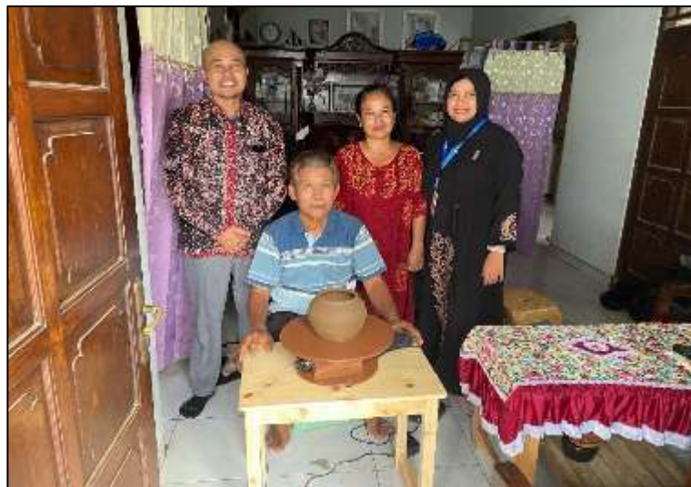
Gambar 5. Penyerahan dan Pelatihan Penggunaan Meja Putar Gerabah Elektrik Ergonomi