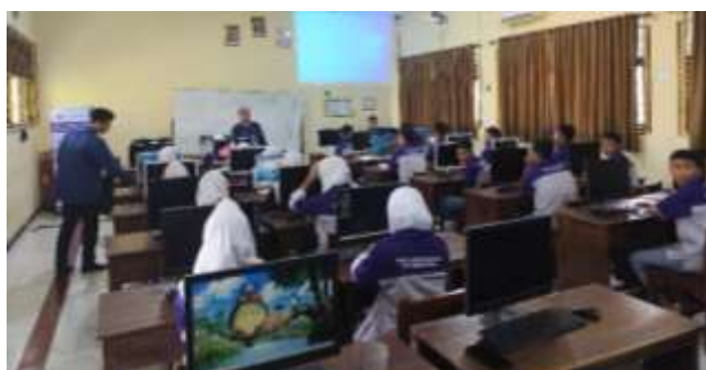
Gambar 2 Menjelaskan tentang CMS WordPress

Kegiatan pengabdian kepada masyarakat yang dilakukan oleh Tim juga didokumentasikan seperti gambar 2, dimana Tim menjelaskan tentang CMS WordPress.