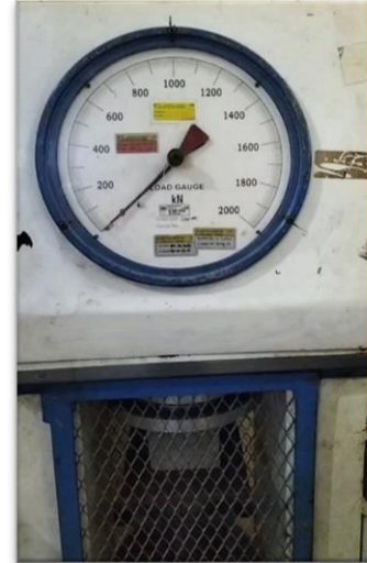
Gambar 3. Proses Pengujian Tekan