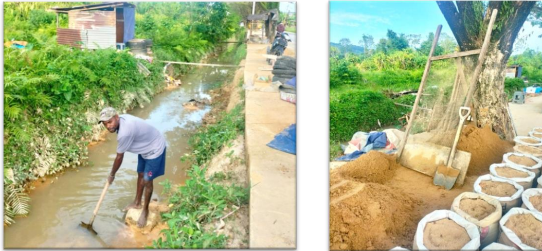
Gambar 1. Pengambilan Sampel Sedimen di Sungai Klagison

telah di olah, dengan melakukan 2 pengujian yaitu pengujian kadar lumpur dan uji kuat tekan terhadap paving block yang telah di buat dengan 1 komposisi perbandingan yaitu 1:3. Untuk selanjutnya dibandingkan hasil kuat tekan dari kedua sampel yang di uji. Berikut adalah sampel sedimen yang akan diuji di uji :