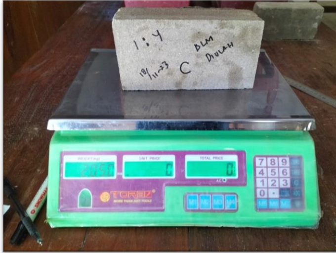
Gambar 2. Sampel Sebelum di Uji Tekan