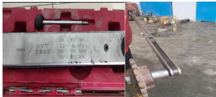
Gambar 1. Pengencangan torsi

Pemasangan Baut Jembatan, untuk penggunaan baut mutu tinggi yang telah digunakan tidak boleh digunakan kembali. Penggunaan alat torsi seperti ditunjukkan pada Gambar 1 dibawah ini