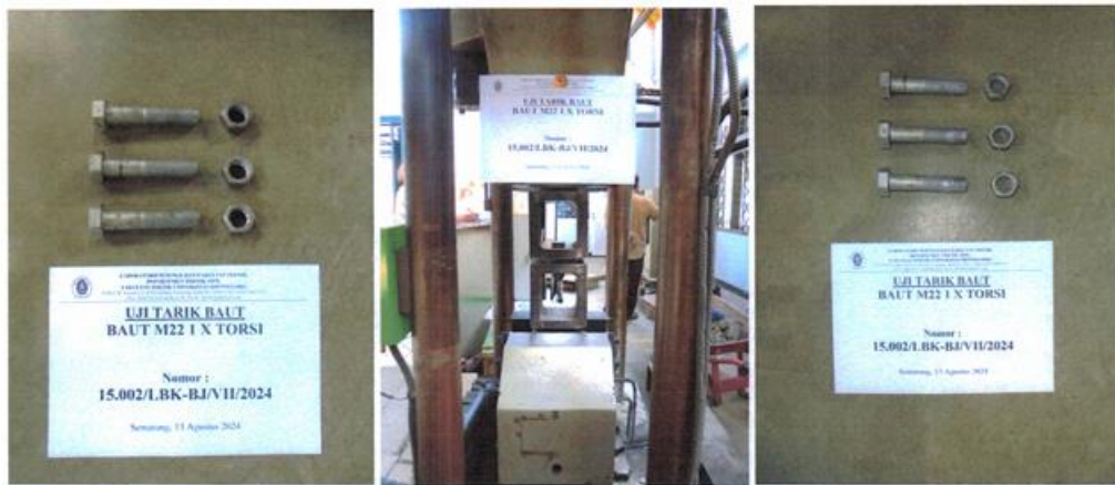
Gambar 4. Kerusakan ulir baut Grade 8.8 M22

Baut Grade 8.8 M22 yang sudah dilakukan torsi secara bervariasi, diketahui mempunyai pola keruntuhan pada ulir baut. Dewobroto et al., (2016) Untuk mengevaluasi baut tidak cukup hanya melihat kuat tarik minimum, tetapi juga bentuk kerusakan saat putus. Dapat dilihat pada Gambar 4. bahwa terlihat semua baut yang dilakukan pengujian torsi mengalami kerusakan pada ulir baut.