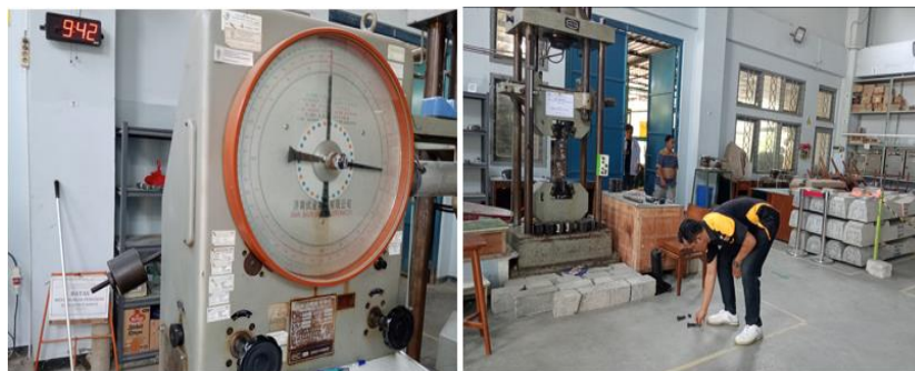
Gambar 2. Laboratorium Uji Tarik

Pengujian baut mutu tinggi Grade 8.8 M22 yang digunakan untuk menentukan kekutan tarik, kekuatan luluh, dan sifat mekanis lainnya dari baut. Pengujian ini dilakukan dengan menarik baut hingga batas titik putus dan mengukur tegangan dan regangan yang dialami. Penelitian dilakukan di Laboratorium Teknik Sipil Universitas Diponegoro dengan menggunakan alat Universal Testing Machine (UTM), seperti Gambar 2 dibawah ini