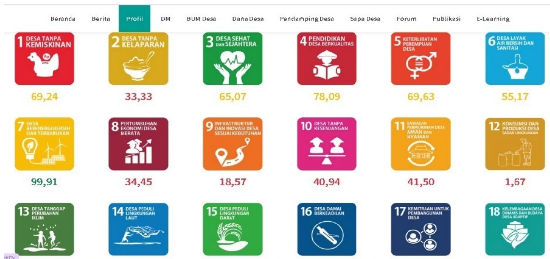
Gambar 1. Sustainable Development Goals Desa Jepang Tahun 2022

Dari gambar diatas dapat dilihat Sustainable Development Goals (SDGS) Desa Jepang Kecamatan Mejobo Kabupaten Kudus. Tahun 2022 dengan berfokus pada SDGS No.1 Desa Tanpa Kemiskinan. Indikator ini mencerminkan tingkat keberhasilan desa dalam mengurangi kemiskinan di semua dimensinya. Dengan skor tertinggi yaitu 100, untuk Desa Jepang sendiri berada pada skor 69,24 dengan artian desa telah menunjukkan kemajuan signifikan dalam upaya pengentasan kemiskinan. Hal ini mencerminkan efektivitas berbagai program yang bertujuan untuk: