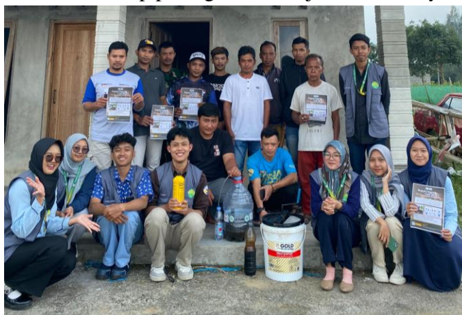
Gambar 2. Foto bersama pasca penyuluhan dan demonstrasi

Kegiatan pengolahan feses domba menjadi pupuk organik cair (POC), yang dilaksanakan melalui rangkaian penyuluhan, demonstrasi, serta pendampingan berkelanjutan, telah memberikan dampak yang signifikan bagi anggota Kelompok Tani Ternak (KTT) Wates di Desa Jambewangi. Melalui kegiatan ini, sasaran program memperoleh pemahaman mengenai manfaat dan teknik pengolahan feses domba mentah menjadi pupuk cair. Feses yang sebelumnya hanya disebar secara langsung di permukaan tanah, kini dapat dimanfaatkan sebagai pupuk cair yang lebih kaya akan kandungan nutrisi untuk mendukung pertumbuhan tanaman. Selain memberikan dampak positif terhadap aspek lingkungan, kegiatan ini juga membuka peluang ekonomi baru bagi anggota KTT dan masyarakat sekitar melalui proses produksi dan pemasaran pupuk organik cair. Dengan demikian, kegiatan ini tidak hanya menjadi solusi pengelolaan limbah organik, tetapi juga turut berkontribusi terhadap peningkatan kesejahteraan masyarakat setempat.