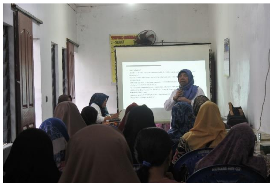
Gambar 1. Pemaparan Materi

Materi edukasi bahan halal yang disampaikan oleh tim PRPH USM berisi tentang implementasi dari materi yang disampaikan sebelumnya khususnya tentang produk halal yang dimulai dari bahan halal, fasilitas, personel dan proses yang bebas dari haram sehingga akan menghasilkan produk yang halal. Pada materi tersebut yaitu tentang pembuatan nugget bandeng. Para peserta mendengarkan pemaparan materi dengan seksama serta aktif dalam sesi tanya jawab.