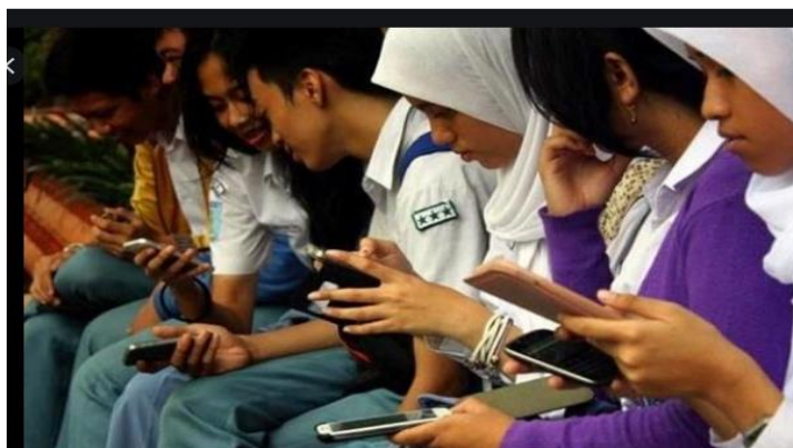
Gambar 1.2. Penggunaan Media Sosial Siswa

Di kalangan anak remaja, terdapat dikotomi bagi mereka yang tidak memahami media sosial mendapat julukan Kudet atau kurang update, maka dari itu karakter-karakter Pancasila harus didorong agar dalam menggunakan media sosial, anak dapat menunjukkan karakter yang baik sesuai kepribadian bangsa Indonesia.