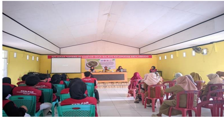
Gambar 3. Pelaksanaan Sosialisasi Pengembangan Pekarangan Rumah kepada Masyarakat Desa Balayo