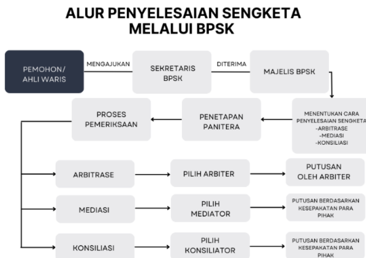
Gambar 1. Alur Penyelesaian Sengketa Melalui BPSK

Pada Gambar 1 dijelaskan terkait pengajuan sengketa konsumen pada BPSK. Pemohon atau ahli waris melakukan pengajuan pada sekretariat BPSK. Jika diterima maka akan dilanjutkan pada Majelis BPSK. Lalu akan ditentukan cara penyelesaian sengketa yaitu dengan arbitrase, mediasi, atau konsiliasi. Apabila mengambil jalur arbitrase, maka akan dipilih arbiter yang nantinya akan menghasilkan putusan arbiter. Jika mengambil jalur mediasi maka akan dipilih mediator yang nantinya akan menghasilkan kesepakatan sesuai para pihak. Lalu jika memilih jalur konsiliasi akan dipilih konsiliator yang nantinya akan menghasilkan putusan kesepakatan sesuai para pihak. 22