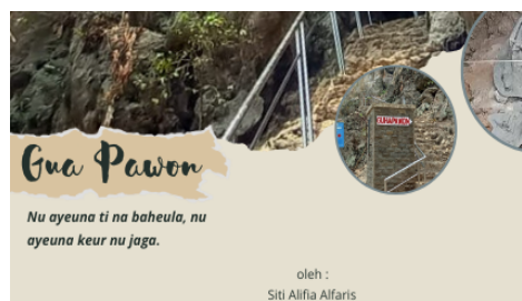
Gambar 1. Tulisan pada Sampul Setelah Disunting

Pada siklus II, seluruh tahapnya cenderung lebih sederhana karena merupakan perbaikan dari siklus sebelumnya. Setelah mendapatkan masukan dari refleksi siklus I, peneliti kembali melakukan perencanaan untuk tindakan-tindakan di siklus II. Perencanaan tersebut yakni mendata hal-hal yang perlu dilakukan untuk tindakan siklus II. Sebagaimana yang tercantum dalam refleksi siklus I, tindakan yang dilakukan oleh peneliti yakni mengubah pilihan kata (diksi) yang terdapat pada kalimat sub judul di bagian sampul booklet .