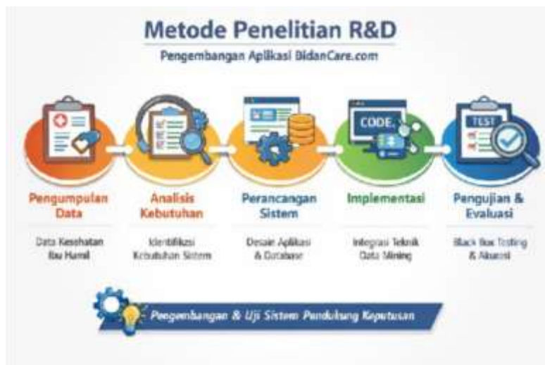
Gambar 1. Metode Penelitian RnD

Penelitian ini menggunakan metode Research and Development (RSD) yang bertujuan untuk mengembangkan dan menguji Aplikasi BidanCare.com sebagai sistem pendukung keputusan dalam memprediksi risiko kehamilan berbasis data kesehatan ibu (Sugiyono, 2019). Tahapan penelitian meliputi beberapa langkah sebagai berikut: