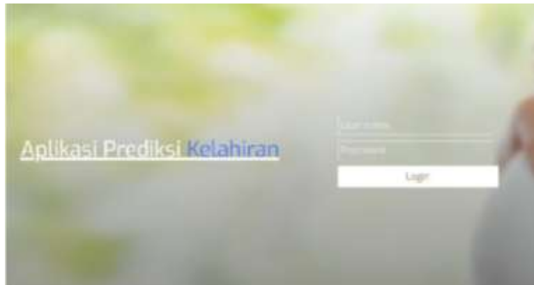
Gambar 1. Tampilan Login Aplikasi

Penelitian ini menghasilkan sebuah aplikasi berbasis web yaitu BidanCare.com yang berfungsi sebagai sistem pendukung keputusan dalam memprediksi risiko kehamilan berdasarkan data kesehatan ibu. Aplikasi ini menyediakan fitur pengelolaan data ibu hamil, proses analisis risiko kehamilan, serta penyajian hasil prediksi dalam kategori risiko rendah, sedang, dan tinggi. Berikut beberapa tampilan aplikasi bidancare.com: