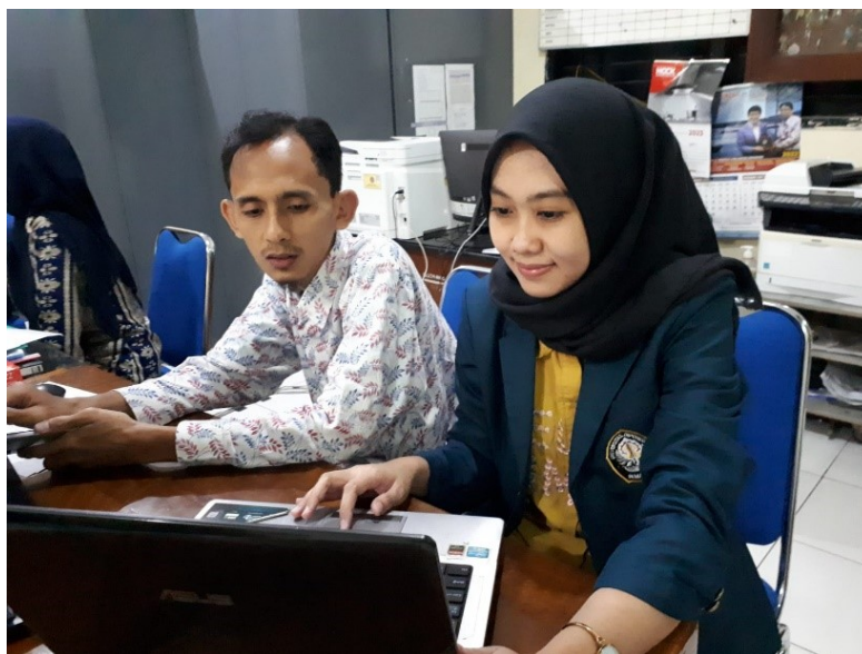
Gambar 8 Wawancara Penggunaan SIPAS 8 dengan Informan 7

Jabatan : Staff Tata Usaha SMK Negeri 8 Semarang