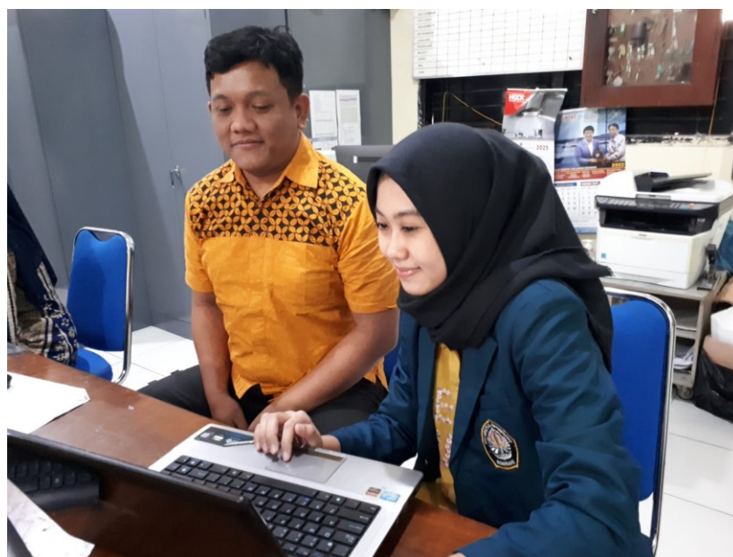
Gambar 7 Wawancara Penggunaan SIPAS 8 dengan Informan 6

Jabatan : Staff Tata Usaha SMK Negeri 8 Semarang