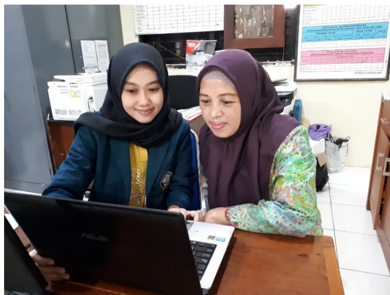
Gambar 6 Wawancara Penggunaan SIPAS 8 dengan Informan 5

Jabatan : Staff Tata Usaha SMK Negeri 8 Semarang