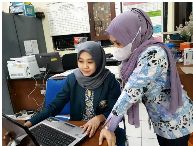
Gambar 4 Wawancara Penggunaan SIPAS 8 dengan Informan 3

Jabatan : Staff Tata Usaha SMK Negeri 8 Semarang