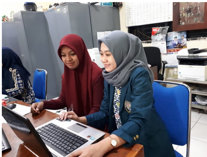
Gambar 3 Wawancara Penggunaan SIPAS 8 dengan Informan 2

Jabatan : Staff Tata Usaha SMK Negeri 8 Semarang