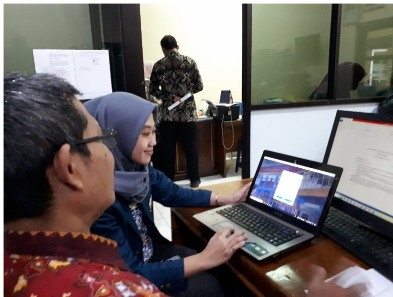
Gambar 2 Wawancara Penggunaan SIPAS 8 dengan Informan 1

Jabatan : Kepala Tata Usaha SMK Negeri 8 Semarang