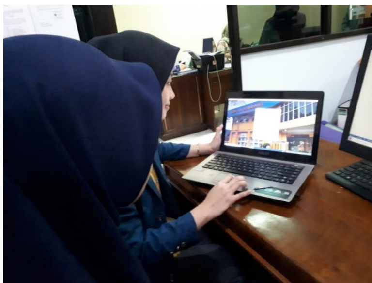
Gambar 5 Wawancara Penggunaan SIPAS 8 dengan Informan 4

Jabatan : Staff Tata Usaha SMK Negeri 8 Semarang