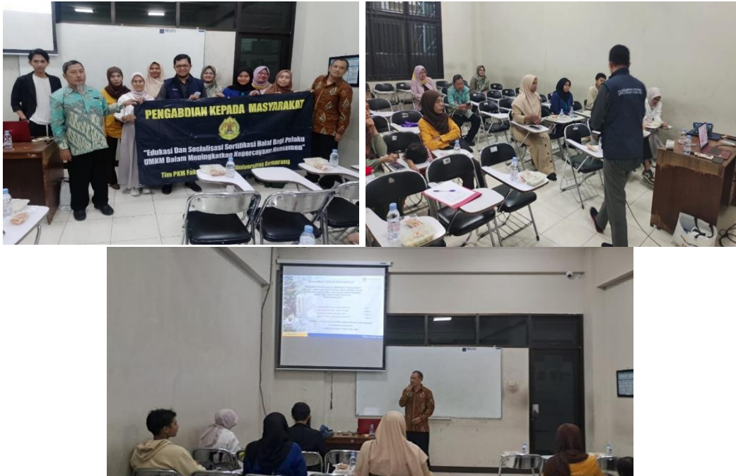
Gambar 3. Situasi Pelaksanaan PKM

Dengan demikian, kegiatan ini tidak hanya memberikan manfaat jangka pendek berupa peningkatan pengetahuan, tetapi juga memiliki dampak jangka panjang dalam membangun budaya kepatuhan terhadap standar halal di tingkat UMKM yang menjadi fondasi penting dalam peningkatan daya saing produk lokal di pasar nasional maupun internasional.