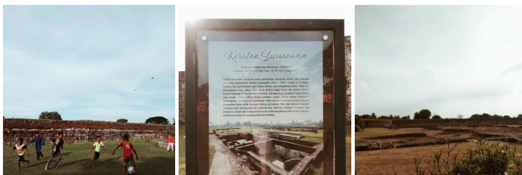
Gambar 1.4 Keraton Surosowan

Keraton merupakan bangunan penting kerajaan karena merupakan pusat kerajaan. Keraton Surosowan terletak di Banten tepatnya di Kabupaten Serang. Keraton ini dibangun pada