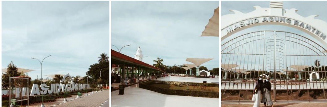
Gambar 1.1 Masjid Agung Banten

Masjid Agung Banten merupakan masjid yang dibangun pada tahun 1652 M pada masa pemerintahan pertama Sunan Gunung Djati yaitu Sultan Maulana Hasanudin. Masjid Agung Banten ini merupakan peninggalan kerajaan Banten sebagai kerajaan Islam di Nusantara yang terletak di desa Banten Lama, Kecamatan Kasemen dan masih berdiri hingga saat ini. Masjid Agung Banten Lama memiliki luas sekitar 1,3 hektar serta memiliki dinding pagar dengan ketinggian 1 meter.