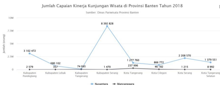
Gambar 1.6 Grafik Jumlah Capaian Kinerja Kunjungan Wisata Di Provinsi Banten Tahun 2018