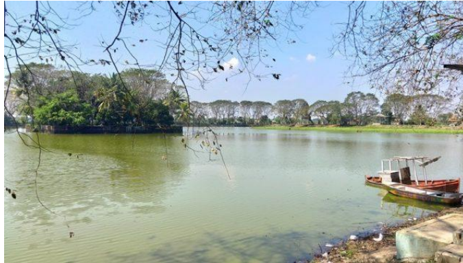
Gambar 1.2 Danau Tasikardi

Pada bagian selatan kawasan Kota Kuno Banten Lama terdapat sebuah waduk buatan yang dinamakan Danau Tasikardi. Air dari danau dikirim dan dialirkan ke Keraton Surosowan melalui tiga penjernih air yang disebut dengan istilah pengindelan. Air hasil saringan tersebut didistribusikan ke sekitar lingkungan Kota Banten Lama. Sistem penjernih air untuk Danau Tasikardi dan Keraton Surosowan saat ini berada di areal persawahan. Saat ini, sistem irigasi tidak berfungsi tetapi kondisi lapangan menunjukkan bahwa sistem dapat dipulihkan dan dihidupkan kembali (Pasaribu, 2019).