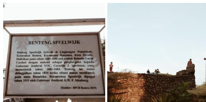
Gambar 1.5 Benteng Speelwijk