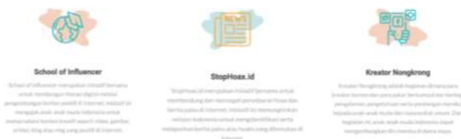
Gambar 3. Kegiatan Siberkreasi

Ancaman radikalisme pada generasi millennial dipengaruhi oleh berbagai faktor seperti media dan teknologi, pendidikan, dan nilai sosial (Subagyo, 2015; Zamzamy, 2019). Oleh karena itu, perlu peningkatan kemampuan literasi digital sebagai pencegahan radikalisme pada generasi muda. Upaya preventif dalam dilakukan dengan menggunakan kontra radikalisasi dengan memanfaatkan berbagai kegiatan yang diadakan oleh Siberkreasi seperti yang ditunjukkan pada Gambar 3. Literasi digital diibaratkan sebagai vaksin untuk menjaga daya tahan tubuh (D. Rahmat, Aliza, & Putri, 2019; Rianto, 2019). Sedangkan, radikalisme sebagai sebuah penyakit yang dapat menyerang siapa saja dan kapan saja. Jika telah diberikan vaksin, maka setidaknya seseorang lebih terlindungi dari berbagai penyakit. Dengan demikian, literasi digital menjadi tameng supaya dapat menangkal terpaparnya radikalisme pada generasi millennial. Berpegang pada literasi digital diharapkan seseorang sebagai pengguna internet mampu menyaring informasi, apakah informasi itu benar atau tidak, dan mampu menghindari dari terpaparnya paham radikal.