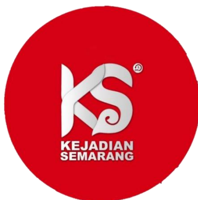
Gambar 1. Logo Akun Instagram

Akun Instagram @kejadiansmg dimulai karena ada permintaan akan informasi yang akurat tentang Semarang, yang mendorong seseorang untuk memulai sebuah outlet berita yang dapat membantu mereka yang terlibat di kota ini. Feed Instagram ini memberikan lebih banyak informasi mengenai isu-isu yang sering terjadi seperti kecelakaan, kemacetan lalu lintas, dan perbaikan jalan. Tujuan dari kampanye Instagram ini adalah untuk mengumpulkan pengguna media sosial yang aktif di wilayah karesidenan Semarang dan mengajak mereka untuk memberikan informasi mengenai kejadian terkini di kota Semarang dan sekitarnya.