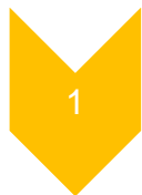
Gambar 2. Tahapan Pelaksanaan Penelitian

Tahapan yang terakhir pemetaan digital dengan menggunakan software Q-GIS. Hasil pemetaan partisipatif kemudian dipetakan secara digital atau menggunakan sistem informasi geografis. Dalam pembuatan PIBT sistem informasi geografis sangat efektif digunakan untuk Digitasi dan Deliniasi batas bidang tanah (Budisusanto et al., 2017; Levitasari et al., 2017; Ujiyanto et al., 2004)