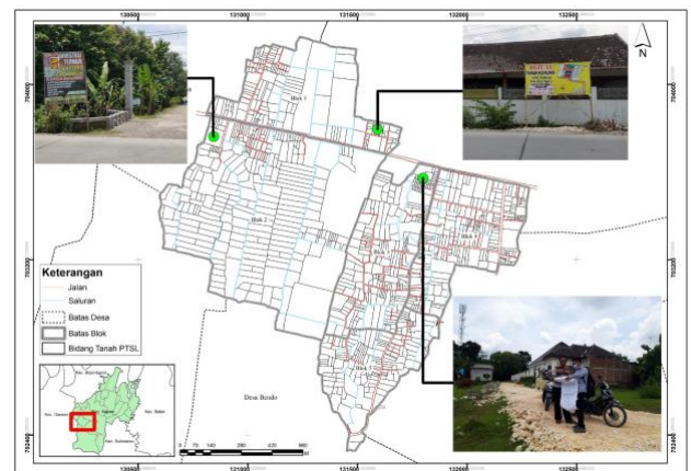
Gambar 5. Perkembangan Perumahan dan Permukiman di Desa Tapelan

bidang, kemudian blok 3 dengan jumlah 13 bidang, lalu blok 4 dengan jumlah bidang 19 bidang dan blok 5 dengan jumlah 5 bidang. Perbedaan bidang tanah yang cukup tinggi terkait adanya perkembangan perumahan dan pemukiman (tanah kavling). Wilayah Desa Tapelan Kecamatan Kapasterletak di wilayah sub urban atau pinggiran kota yang mempunyai orde 2 setelah Kabupaten Bojonegoro (Rendra & Fitriansyah, 2020). Faktor tersebut menjadi salah satu pilihan kebutuhan permukiman. Untuk lokasi perubahan bidang adanya perkembangan perumahan dan pemukiman dapat dilihat pada Gambar 5.