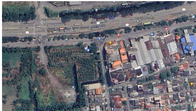
Gambar 1 . Titik lokasi penelitian

Lokasi perencanaan gedung hotel ini terletak di Kota Semarang di Jl. Tanjung Mas Raya, Panggung Lor, Kecamatan Semarang Utara, Kota Semarang, Provinsi Jawa Tengah. Dengan sistem struktur yang digunakan yaitu beton bertulang dengan jumlah lantai sebanyak 6 lantai. Perencanaan gedung hotel ini diasumsikan menggunakan mutu beton K-300.