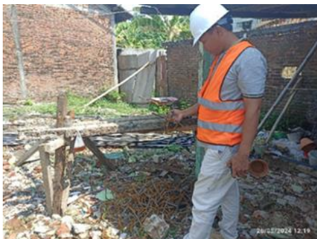
Gambar 3. Limbah besi