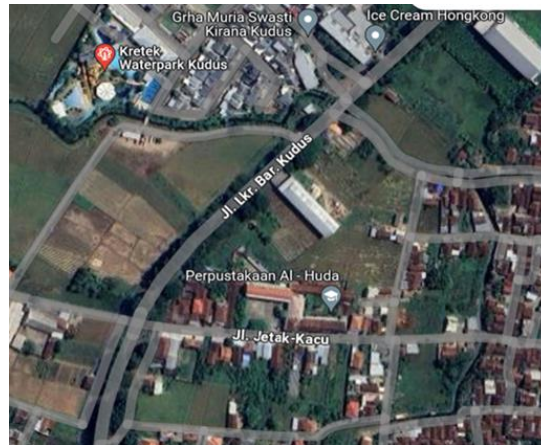
Gambar 1 . Denah lokasi proyek

Lokasi penelitian limbah konstruksi yang dilakukan dalam penelitian ini dapat dilihat pada Gambar 1. Dalam penelitian ini, yang dijadikan objek penelitian adalah proyek Pembangunan Gedung Roudlatul Ulum Terpadu Nurul Huda Kabupaten Kudus. Data ini didapatkan dengan cara upaya penilaian mandiri dan pengambilan data di lapangan pada Proyek Pembangunan Gedung.