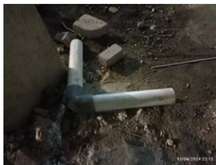
Gambar 9. Limbah pipa saluran