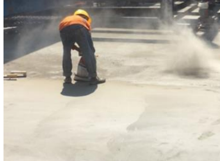
Gambar 7. Limbah beton