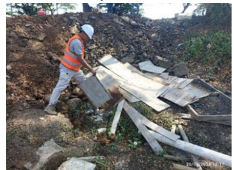
Gambar 5. Limbah kayu

c. Penyediaan fasilitas khusus untuk material yang mengandung limbah B3 dengan standar penyimpanan yang optimal, disesuaikan dengan hasil simulasi perhitungan volume. Fasilitas ini juga dilengkapi dengan media absorben untuk penanganan yang tepat.