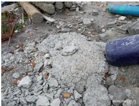
Gambar 2. Limbah beton