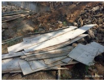
Gambar 8. Limbah kayu