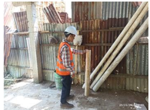
Gambar 4. Limbah pipa saluran