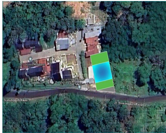
Gambar 1 . Titik lokasi penelitian

Titik lokasi penelitian berlokasi di Jl. Gunung Pati Raya, Ngijo, Kecamatan Gunungpati, Kota Semarang pada koordinat -7.078178, 110.374206 seperti tersaji pada Gambar 1.