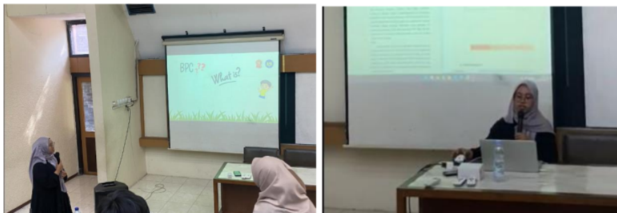
Gambar 2. Tanya Jawab dengan Peserta Pelatihan Mengenai Ide Bisnis Bidang Teknik

Setelah selesai dipaparkannya materi pelatihan business plan, para peserta diberikan kesempatan untuk memberikan pertanyaan dan menanggapi pertanyaan setiap peserta pelatihan yang bertanya. Kebanyakan dari peserta pelatihan sangat antusias bertanya mengenai teknologi yang bisa dijadikan inovasi bisnis dan mulai konsultasi mengenai ide yang mereka buat. Peserta pelatihan bertanya mengenai segmentasi pasar produk teknologi dan manufaktur seperti mobil permainan cerdas berbahan fiber carbon , smarthome , aplikasi digital dan bertanya mengenai analisis kelemahan-kelemahan dari ide tersebut. Narasumber juga memberikan penjelasan kecil mengenai social entrepreneurship, harapannya ide-ide yang muncul dari mahasiswa fakultas teknik berdasar kepada penyelesaian masalah yang timbul dalam masyarakat melalui produk tersebut sehingga masyarakat mulai merasakan manfaat dari bisnis yang sedang dibangun.