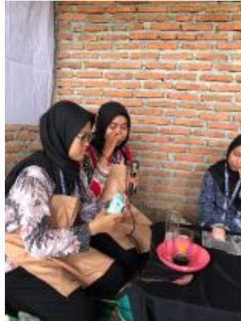
Gambar 4. Inovasi Pangan melalui Demo Masak

dengan lancar dan berhasil. Peserta dapat memahami dan bisa uji produk secara langsung. Peserta antusias dalam pelaksanaan demo masak ini yang tergambar dari keikutsertaan peserta dalam melihat demo masak, serta banyaknya pertanyaan yang dilontarkan.