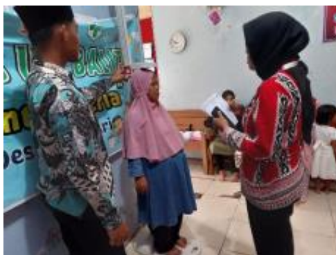
Gambar 2. Pengukuran Tinggi Badan Ibu Hamil

Kehamilan yang optimal perlu mempersiapkan fisik ibu hamil agar tercapai proses kelahiran yang mudah. Hal ini perlu disiapkan dengan melakukan pemantauan status gizi salah satunya melakukan pengukuran IMT pada awal kehamilan atau disebut IMT pra hamil (Gambar 2). Dengan pengukuran IMT tersebut nantinya dapat diperoleh juga pemantauan berat badan dan tinggi badan. Perlu diketahui, dalam pemeriksaan Ante Natal Care (ANC) di Indonesia, pengukuran terhadap berat badan dan tinggi badan ibu hamil telah menjadi standar didalam pemeriksaan. Pengukuran IMT pra hamil merupakan bentuk pengawasan status gizi awal akan risiko selama kehamilan beserta calon bayi yang akan dilahirkan (Riantika et al. , 2022).