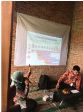
Gambar 3. Penyampaian Edukasi Gizi