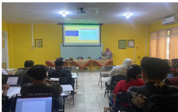
Gambar 2. Pelaksanaan Pelatihan Mendeley

Tahap pelaksanaan berupa kegiatan pelatihan penggunaan aplikasi Mendeley . Peserta diberikan materi tentang Mendeley dan bagaimana cara meng- install aplikasi tersebut kedalam laptop peserta, kemudian melaksanakan tutorialnya (Gambar 2). Kegiatan dilaksanakan pada tanggal 05 Januari 2024 pada pukul 10.00 s.d 12.00 WIB.