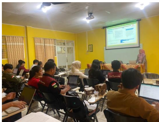
Gambar 4. Pemberian Materi Pelatihan Kepada Peserta

Materi disampaikan dengan metode ceramah dengan presentasi menggunakan slide ppt . Selanjutnya, penggunaan aplikasi Mendeley kemudian dipraktikkan secara langsung oleh peserta. Berikut adalah dokumentasi kegiatan (Gambar 4).