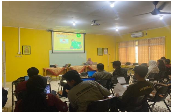
Gambar 3. Pengisian Kuisisioner

Kegiatan pengabdian masyarakat ini menggunakan metode pelaksanaan berupa ceramah, simulasi, dan tanya jawab. Adapun tahapan-tahapan dalam pelaksanaan kegiatan pengabdian adalah sebagai berikut: