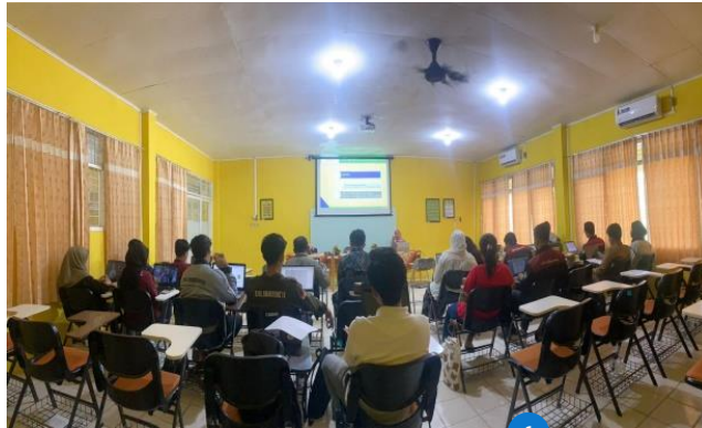
Gambar 1. Tempat Pelaksanaan Pelatihan

Pada tahap perencanaan, beberapa hal telah ditetapkan, termasuk tempat atau lokasi kegiatan. Gambar 1 menunjukkan lokasi pengabdian, yang dilaksanakan di Program Studi Teknik Sipil Universitas Lancang Kuning.