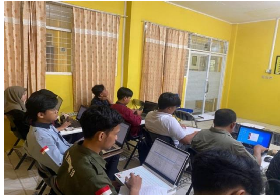
Gambar 7. Peserta Menggunakan Aplikasi Mendeley