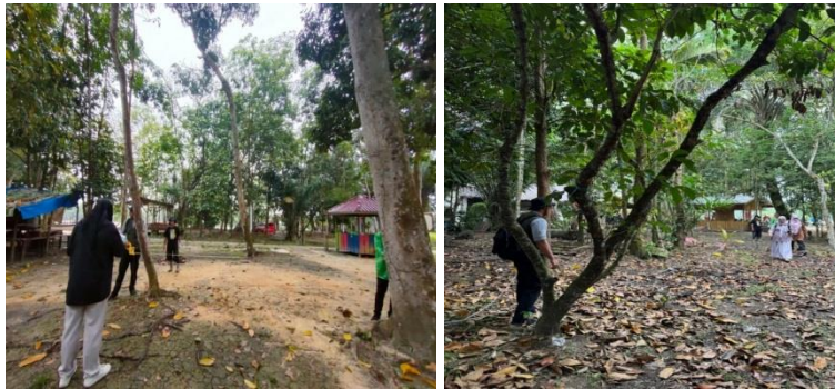
Gambar 1. Pengukuran Lokasi Area Parkir Tempat Wisata Pulau Semut

Tahapan pada kegiatan pengabdian ini dimulai dengan tahap diskusi. Diskusi dilaksanakan pada tanggal 28 April 2025 untuk mendengarkan keinginan dari mitra yang diwakili oleh ketuanya yaitu Pak Edi dan masyarakat setempat dan memberikan masukan terkait lokasi area parkir objek wisata Pulau Semut yang akan dibuatkan perencanaannya. Selanjutnya adalah pengumpulan data dan perencanaan. Pada bagian ini, metode dilakukan dengan cara pengukuran dari area parkir objek wisata tersebut serta membuat sketsa gambar dari area parkir. Pada saat pengukuran didampingi oleh mitra dan beberapa masyarakat setempat. Gambar 1 adalah dokumentasi saat pengukuran lokasi. Tampilan situasi pada area parkir tempat wisata Pulau Semut disajikan pada Gambar 2.