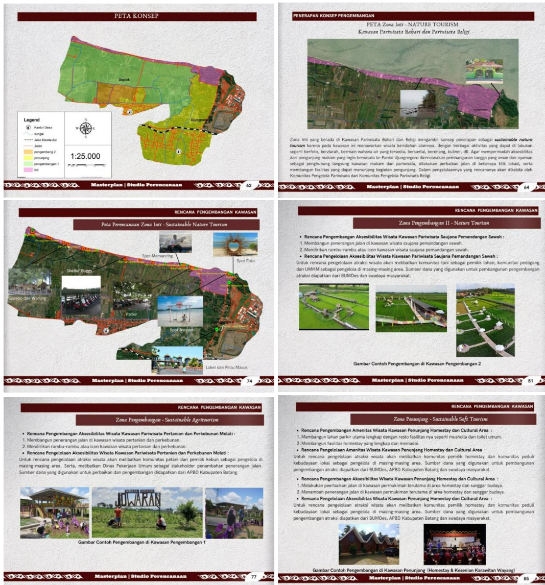
Gambar 4. Konsep Masterplan

zona pengembangan I dengan konsep agrotourism di kawasan pertanian dan perkebunan. Sedangkan zona 3 yaitu zona pengembangan II dengan konsep soft tourism untuk penyelenggaraan dan pelestarian kebudayaan serta penyediaan akomodasi berupa homestay .