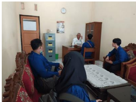
Gambar 1. Koordinasi Awal Kegiatan

Tahap ini merupakan awal dari proses kegiatan. Pada tahapan ini kelompok bersurat dan melakukan pendekatan kepada instansi terkait seperti BAPPELITBANG Kabupaten Batang, Dinas Pariwisata Kabupaten Batang, Pemerintah Kecamatan Kandeman, Pemerintah Desa Ujungnegoro dan Desa Depok serta masyarakat desa. Koordinasi juga dilakukan dengan pengurusan perizinan kepada pemerintah desa dan kepala dusun yang berada di lingkungan tempat tinggal sementara saat melakukan observasi langsung. Selain itu koordinasi tim juga dilakukan untuk pembagian tugas dalam pengumpulan data dan pembagian lokasi survey demi kelancaran kegiatan survey lapangan (Gambar 1).