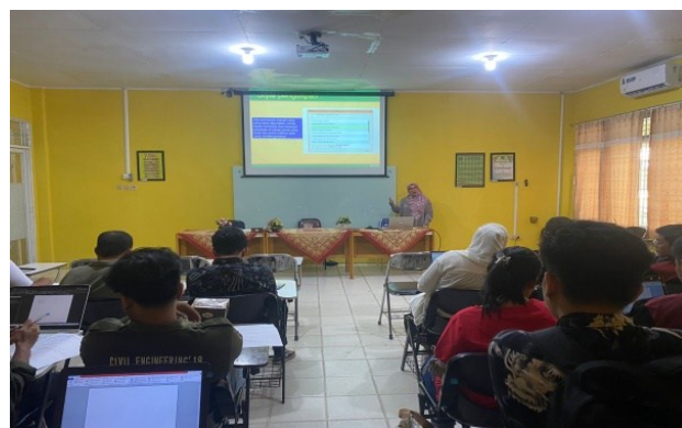
Gambar 2. Pelaksanaan Pelatihan Mendeley

Tahap pelaksanaan berupa kegiatan pelatihan penggunaan aplikasi Mendeley . Peserta diberikan materi tentang Mendeley dan bagaimana cara meng- install aplikasi tersebut kedalam laptop peserta, kemudian melaksanakan tutorialnya (Gambar 2). Kegiatan dilaksanakan pada tanggal 05 Januari 2024 pada pukul 10.00 s.d 12.00 WIB.