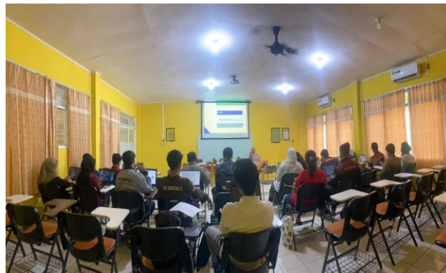
Gambar 1. Tempat Pelaksanaan Pelatihan

Pada tahap perencanaan, beberapa hal telah ditetapkan, termasuk tempat atau lokasi kegiatan. Gambar 1 menunjukkan lokasi pengabdian, yang dilaksanakan di Program Studi Teknik Sipil Universitas Lancang Kuning.