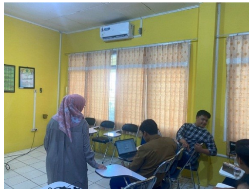
Gambar 5. Pendampingan Penggunaan Aplikasi Mendeley

Sebelum tim pengabdian melaksanakan pelatihan ini, peserta terlebih dahulu diberikan aplikasi Mendeley . Pada saat pelatihan peserta dipandu untuk cara install Mendeley , input sumber pustaka, memperbaiki metadata pada Mendeley , menggunakan Mendeley yang terhubung dengan Microsoft Word dan pembuatan daftar pustaka melalui Mendeley . Berikut merupakan dokumentasi kegiatan pendampingan penggunaan Mendeley (Gambar 5).