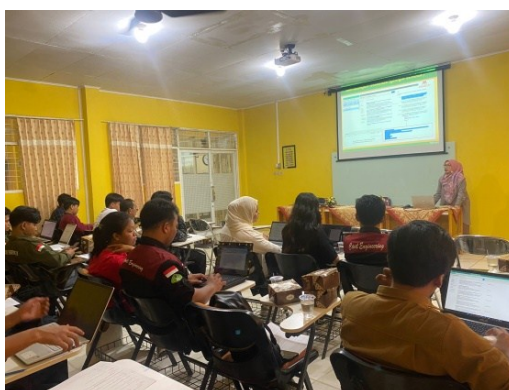
Gambar 4. Pemberian Materi Pelatihan Kepada Peserta

Materi disampaikan dengan metode ceramah dengan presentasi menggunakan slide ppt . Selanjutnya, penggunaan aplikasi Mendeley kemudian dipraktikkan secara langsung oleh peserta. Berikut adalah dokumentasi kegiatan (Gambar 4).