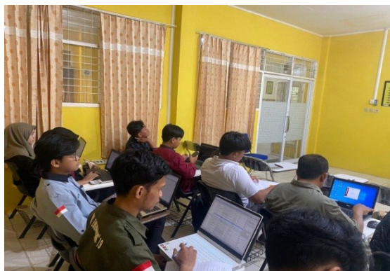
Gambar 7. Peserta Menggunakan Aplikasi Mendeley