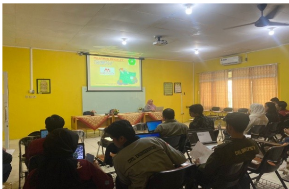
Gambar 3. Pengisian Kuisisioner

Kegiatan pengabdian masyarakat ini menggunakan metode pelaksanaan berupa ceramah, simulasi, dan tanya jawab. Adapun tahapan-tahapan dalam pelaksanaan kegiatan pengabdian adalah sebagai berikut: