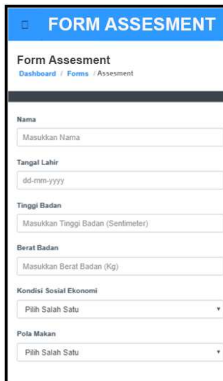
Gambar 2: Form Assesment

Tampilan diatas merupakan tampilan dari halaman login admin. Admin dapat melakukan input user name dan password yang sesuai sebelum melakukan pengelolaan terhadap nilai core factor ataupun secondary factor yang dapat dikelola dalam Form Setting Sub Aspek, Form Setting Aktivitas Fisik, Form Setting Frekuensi Pola Makan, Form Setting IMT/U, Form Setting Kondisi Ekonomi .