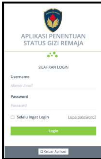
Gambar 1 : Halaman Login

Tampilan diatas merupakan tampilan dari halaman login admin. Admin dapat melakukan input user name dan password yang sesuai sebelum melakukan pengelolaan terhadap nilai core factor ataupun secondary factor yang dapat dikelola dalam Form Setting Sub Aspek, Form Setting Aktivitas Fisik, Form Setting Frekuensi Pola Makan, Form Setting IMT/U, Form Setting Kondisi Ekonomi .